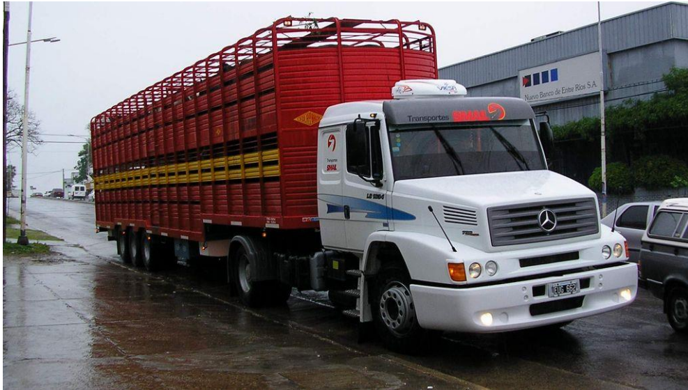
Figura N° 3. Tractor con semirremolque jaula de doble piso

Un semirremolque jaula común (de un solo piso) puede transportar hasta unos 16.000 kilogramos, lo que arroja una media de unos 40 animales grandes y unos 60 animales pequeños (terneros y novillos); un semirremolque jaula de doble piso puede transportar hasta 30 toneladas de animales pequeños (terneros y novillos), lo que arroja una media de unos 140 animales pequeños.