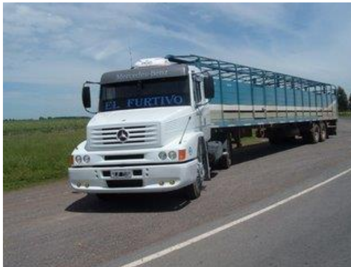
Figura N° 2. Equipo para el traslado de hacienda: Tractor y semirremolque jaula

La jaula tiene características especiales para poder transportar animales vivos: tiene que