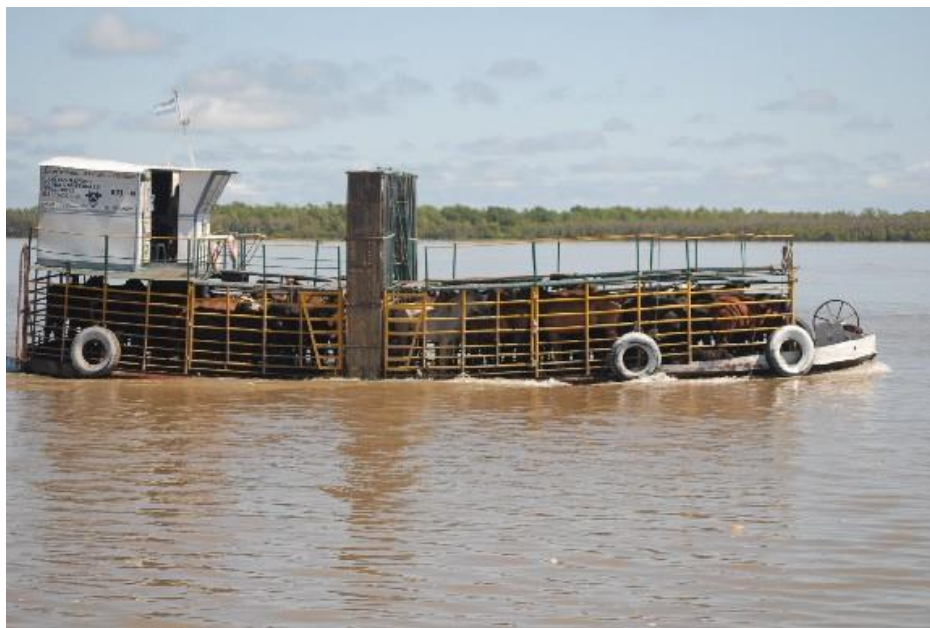
Figura N° 1. Embarcación destinada al transporte fluvial de animales

De todas formas, su presencia es absolutamente reducida por lo que en este informe se asigna al modo automotor la totalidad de los movimientos de hacienda.